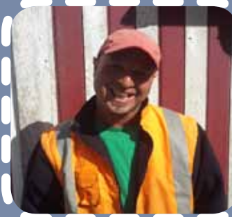
AZoumi, Eeklo, BE