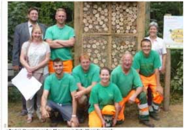
• Dit zijn de ploegen van 46 mensen in Halle-Vilvoorde aan de slag.

IEROEF In Halle-Vilvoorde van 46 arbeiders in het beheer van